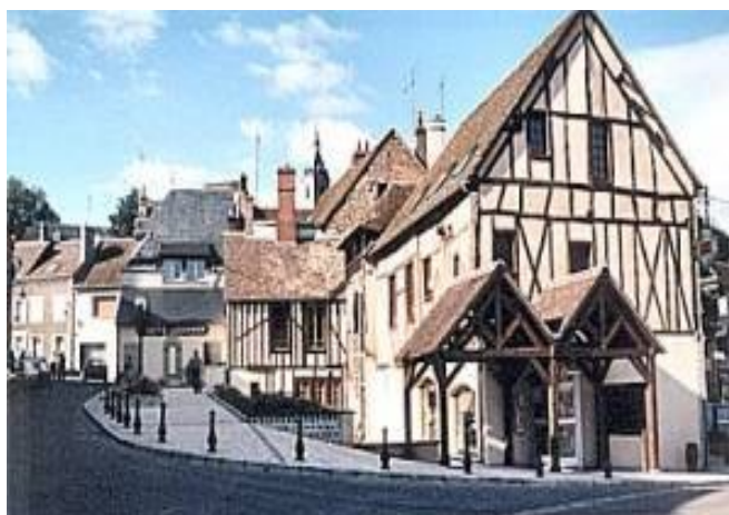
Vue du centre-bourg

Le service gestionnaire est la Direction Régionale des Affaires Culturelles, Service Territorial de l'Architecture et du Patrimoine, 6 rue de la Manufacture 45043 Orléans Cédex 1.