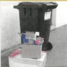
Ne pas mettre les déchets en vracs à côté du bac