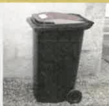
Rentrer le bac après la collecte pour laisser la voie libre