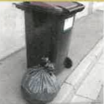
Ne pas déposer de sac hors du bac