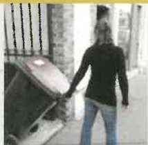
Sortir le bac la veille du jour de collecte