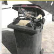
Ne pas surcharger le bac et fermer le couvercle