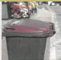
Présenter le bac de manière visible, poignée tournée vers la route